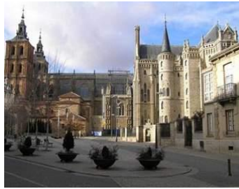
Catedral de Astorga