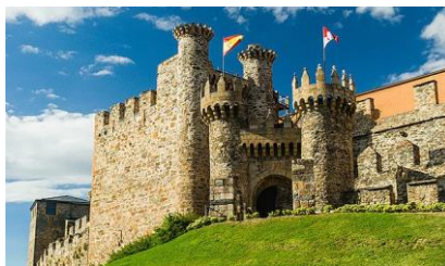
Castelo de Ponferrada